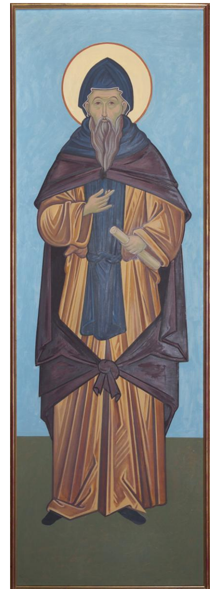
sv. Cyril se svitkem evangelia ve slovanském písmu