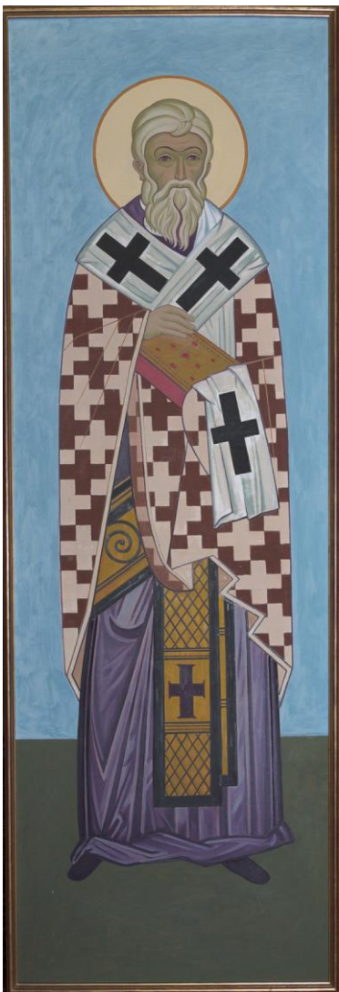
sv. Metoděj v biskupském rouchu s evangeliářem

Draží bratři a sestry, nesmíme zapomínat, že jsme potomci a dědicové duchovního odkazu sv. Cyrila a Metoděje. Odkaz těchto světců bude živ přesně do té míry, do jaké se každý z nás k tomuto odkazu vědomě přihlásí.